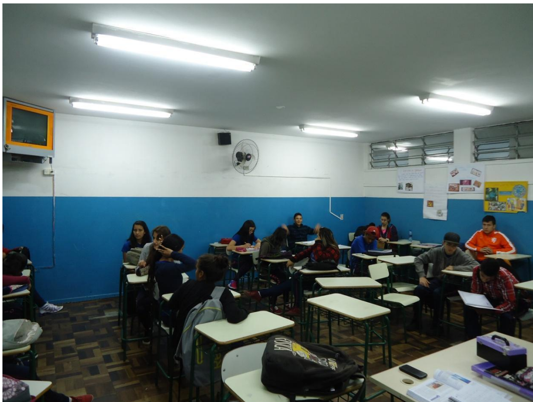
Figura 5. Primeiro dia de aula da SD.

Anexo 1. Fotos da turma durante as aulas da Sequência Didática.