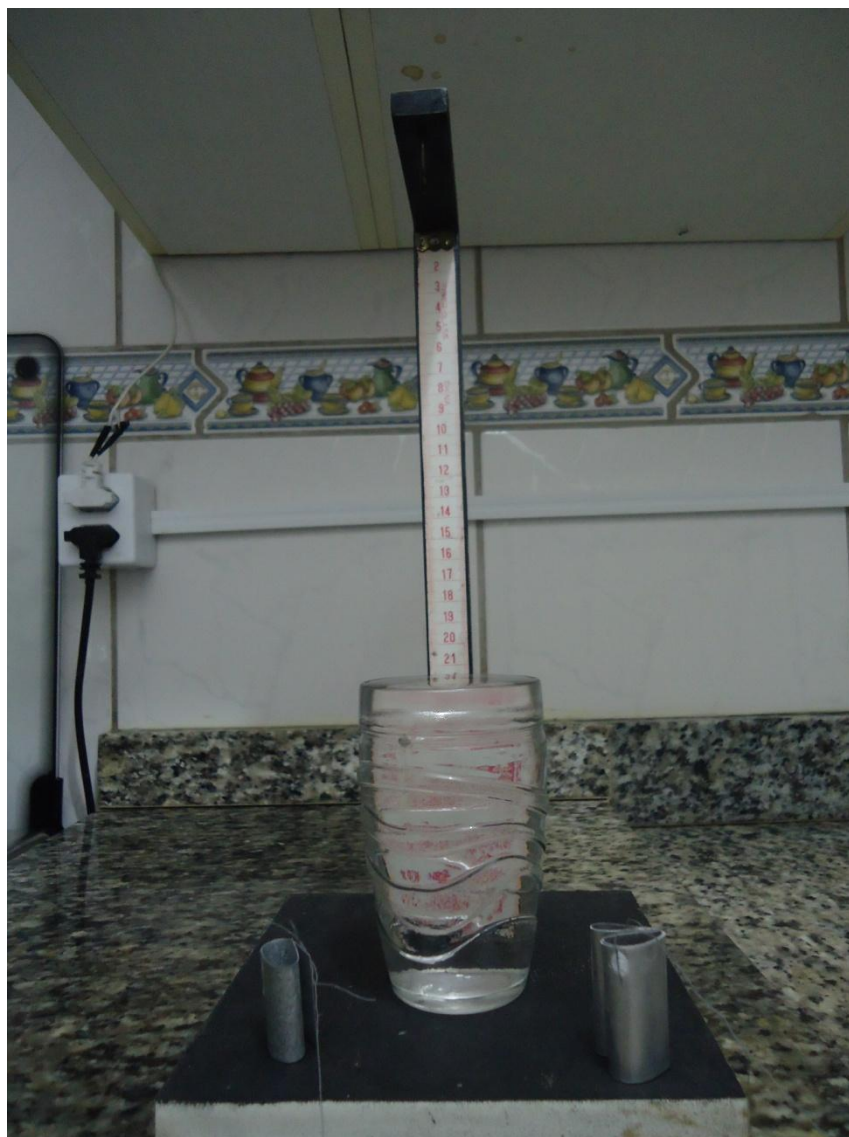
Figura 1. Equipamentos utilizados no experimento.

O experimento realizado teve um caráter demonstrativo, pois não foi possível conseguir material para todos os alunos. O objetivo do experimento foi o de verificar a possível veracidade física do mito de que Arquimedes teria utilizado as medidas dos pesos da água derramada para descobrir a fraude, como foi visto pelos alunos, esse método não funciona com precisão, pois ao colocar um corpo em um recipiente completamente cheio de água, pode ou não ocorrer derramamento do líquido.