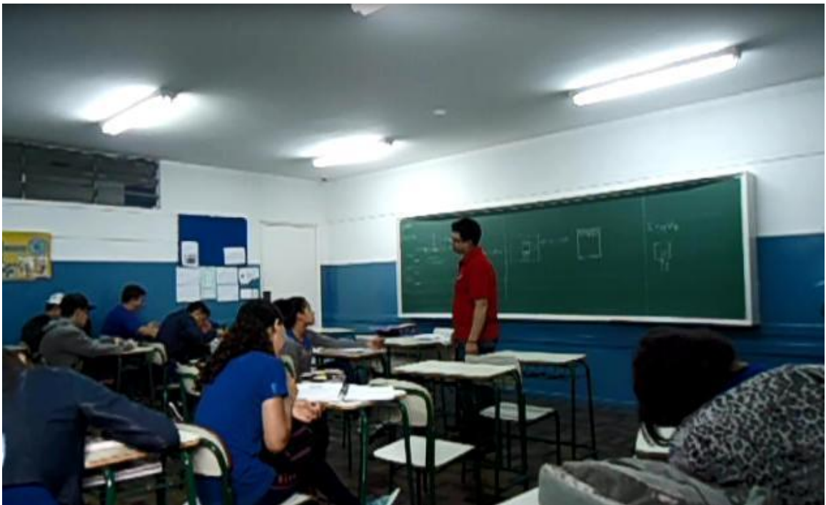
Figura 7. Último dia de aula.