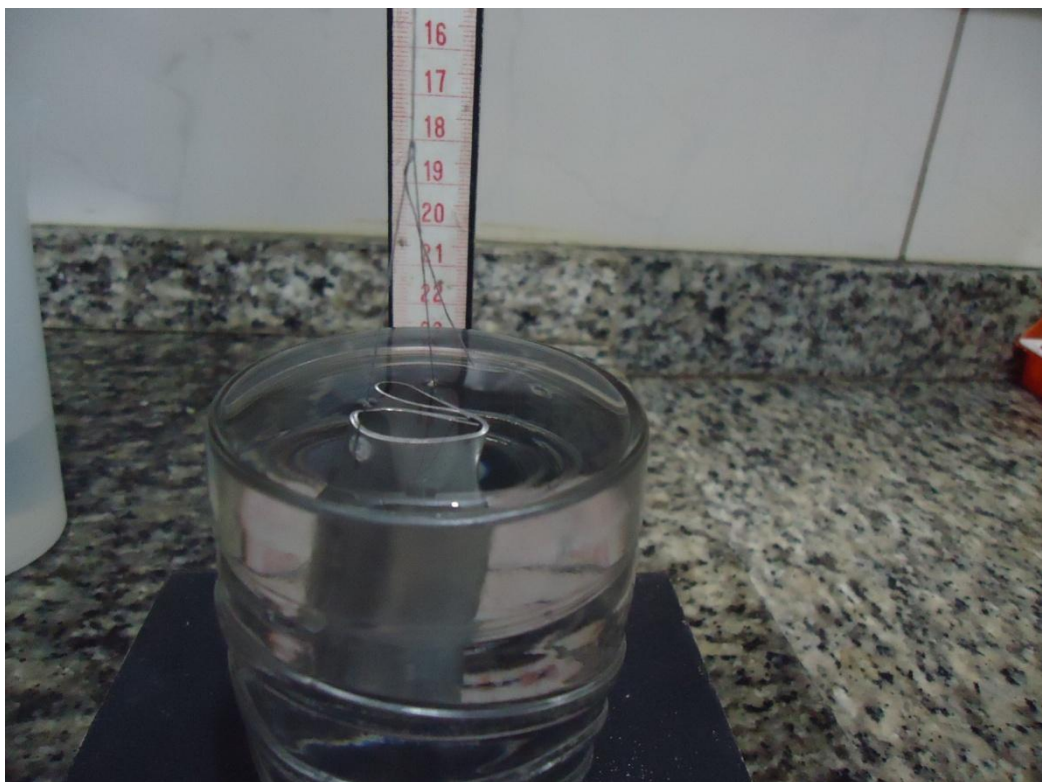
Figura 3. Chapa de alumínio submersa.