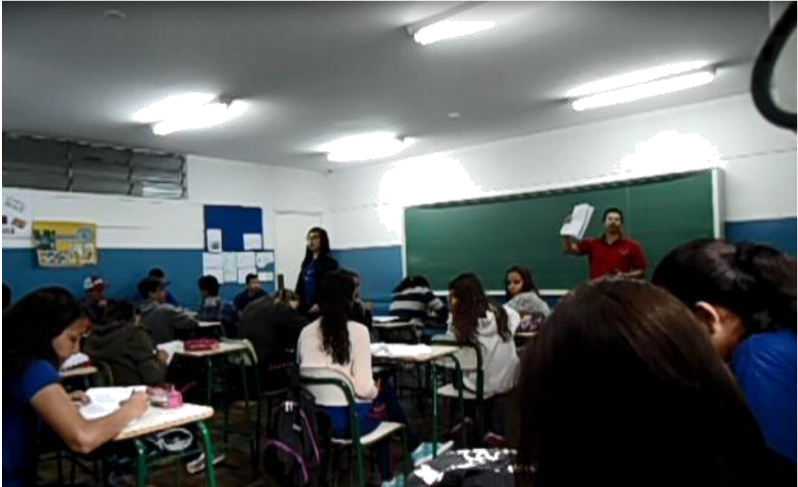
Figura 6. Terceira aula, dia do experimento.