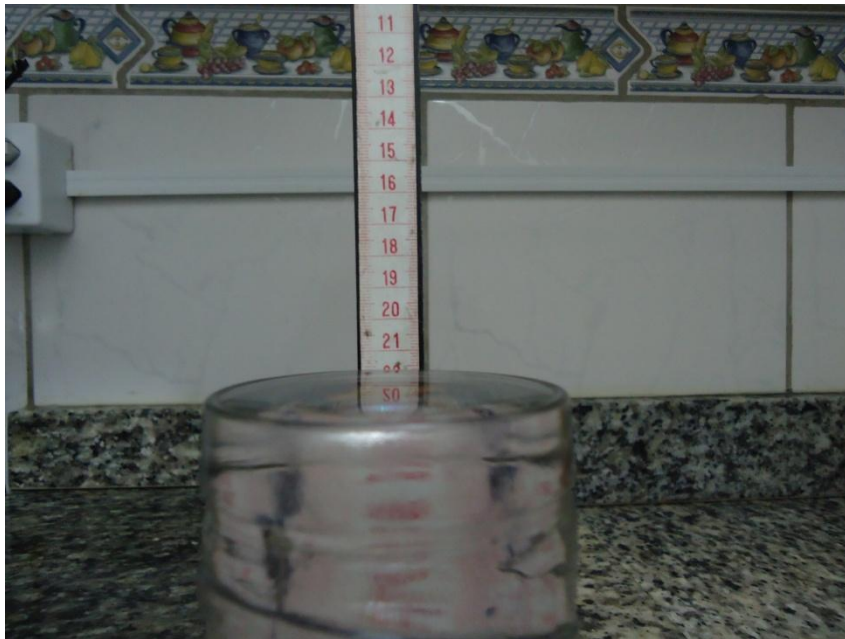
Figura 2: Copo completamente cheio de água.